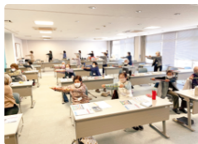
令和5年度はつらつ講座