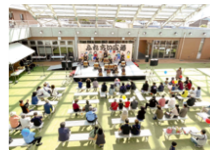
第41回吉田町ふれあい広場