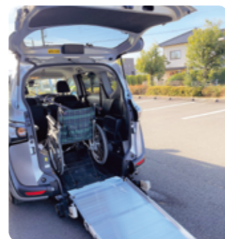
車いす・リフト車の貸出